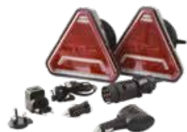
KIT D'ÉCLAIRAGE À LED CONNIX - PLUS