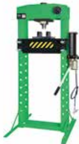
PRESSE ATELIER HYDRAULIQUE 30 T