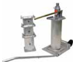
CRIC CRISSUR 15 T HT.1750 MM