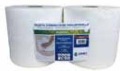
SPÉCIALE TRAITE PUNTO

Bobine ouate blanche - T1000F - 2 plis - point à point - 24 x 26