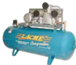
COMPRESSEUR FIXE À COURROIE 55 W 500 T

Triphasé 55 m³/h sur cuve 500 litres - Groupe fonte tricylindre en W gros débit, monoétage - Moteur 10 CV - 11 bar maxi