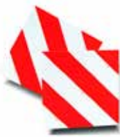
KIT 2 PAN.LAT 423 X 423 1 G + 1 D CL.1