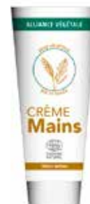
CRÈME MAINS EN TUBE DE 75 ML

Formulée pour les mains sèches et abîmées grâce à une association d'actifs d'origine végétale