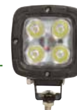
PHARE DE TRAVAIL À LED, 4000 LUMENS